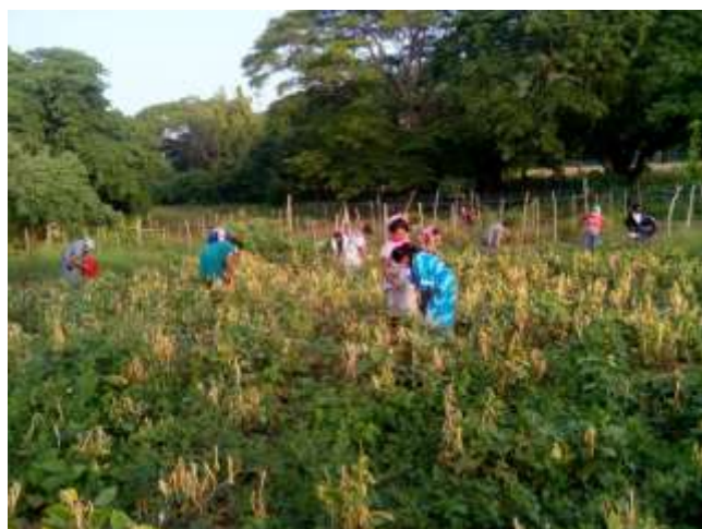
Recolección de cosecha de frijol Guajirito, ubicada en corregimiento de Majayura, en el municipio de Maicao en La Guajira.

Por otra parte, las actividades para la producción de alimentos y recuperación de medios de vida en contextos rurales se reactivaron mediante modalidad presencial, bajo estrictas medidas de bioseguridad. Asimismo, con la reapertura económica del país, y un incremento de los flujos de refugiados y migrantes que entran al país, se hizo énfasis en la provisión de asistencia alimentaria a través de kits alimentarios en puntos de apoyo humanitario en algunas de las rutas de movilidad. Finalmente, los socios que realizan actividades de atención nutricional han optado por priorizar zonas, y acordar con las familias citas para la atención domiciliaria. En todos los casos, se cumplen con las medidas de bioseguridad y atención en espacios abiertos, y para casos específicos se han programado citas en hospitales o puntos de atención.