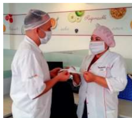
Por medio del proyecto "Empleos para construir futuro" se ha entregado kits de bioseguridad a trabajadores y trabajadoras, incluyendo a refugiados y migrantes venezolanos y colombianos retornados de la empresa socia Salamanca.

Durante el mes de septiembre, más de 5.000 beneficiarios recibieron una o más asistencias a través de 32 socios e implementadores del RMRP, en 17 municipios de 8 departamentos, tanto fronterizos como de permanencia de refugiados y migrantes. En septiembre se observó, respecto a agosto, un incremento del número de refugiados y migrantes que fueron apoyados para fortalecer sus capacidades de generación de ingresos. En emprendimiento, se realizaron capacitaciones en registro de cuentas, logística y distribución, comercialización, habilidades blandas y se entregaron capitales semillas a varias unidades productivas. En empleabilidad, se realizaron actividades de difusión de información sobre las medidas de mitigación del impacto del COVID-19 en el empleo, se entregaron elementos de bioseguridad para el trabajo y se hicieron capacitaciones virtuales para el fortalecimiento de habilidades blandas y técnicas acordes a las necesidades del mercado laboral.