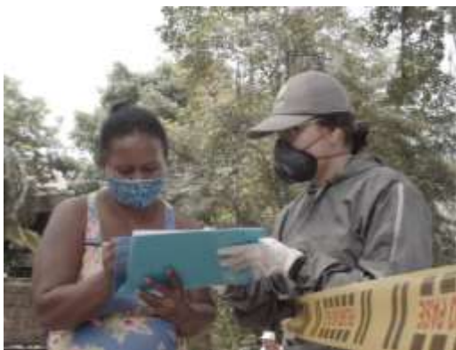
Atención a refugiados y migrantes en tránsito que se encuentran en Bucaramanga (Santander).

Durante el mes más de 37.200 beneficiarios recibieron una o más asistencias a través de 30 socios e implementadores del RMRP, en 35 municipios de 18 departamentos, tanto en zonas de frontera como de tránsito y asentamiento de refugiados y migrantes.