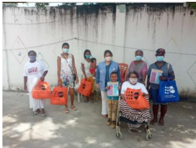
Entrega de kits de dignidad.