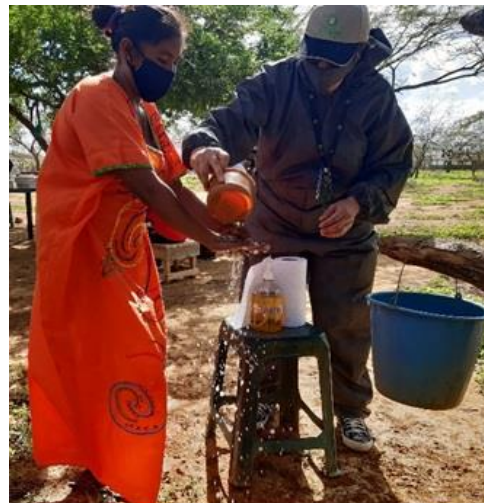
Lavado de manos y mejoramiento de las prácticas de higiene en comunidades de Uribia.

5.329 personas beneficiadas de información, educación y comunicación en salud.