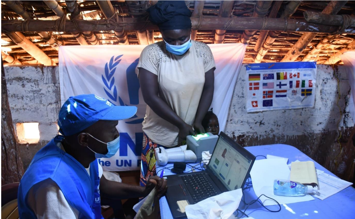
Le HCR et la CNR procède à l'enregistrement biométrique des nouveaux demandeurs d'asile Ndu, province du Bas-Uele