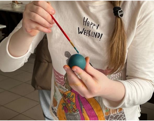
Copii refugiați vopsind ouă de Paște cu speranța că vor fi din nou acasă.