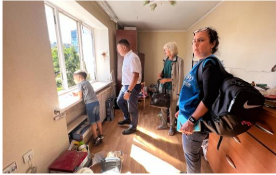
Керівник Вінницького регіонального офісу УВКБ ООН відвідує будинок, пошкоджений внаслідок обстрілу, щоб оцінити потреби.

Швидке реагування: негайна екстрена підтримка місцевої влади після ракетних ударів. Внаслідок обстрілу в центрі Вінниці 14 липня було пошкоджено понад 700 квартир у понад 70 будинках, у тому числі приватних будинках – пошкодження стін, розбиті вікна. У тісній координації з місцевою владою УВКБ ООН та Кластер з житлових питань змогли швидко надати брезенти та покрівельні матеріали, щоб допомогти захистити та відремонтувати emergency sdhni пошкоджені будівлі. У Дніпрі ракета влучила в МКП на заводі Південмашу, де станом на 15 липня проживали понад 160 переселенців. Предмети допомоги та матеріали для укриття були розподілені як негайне реагування для підтримки постраждалих.