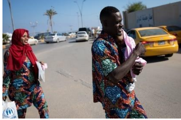
وصول طالبي اللجوء إلى المطار قبيل رحلة الإجلاء.

1 المنظمة الدولية للهجرة- مصفوفة تتبع النزوح: يونيو 2022 2 البيانات حتى 1 نوفمبر 2022