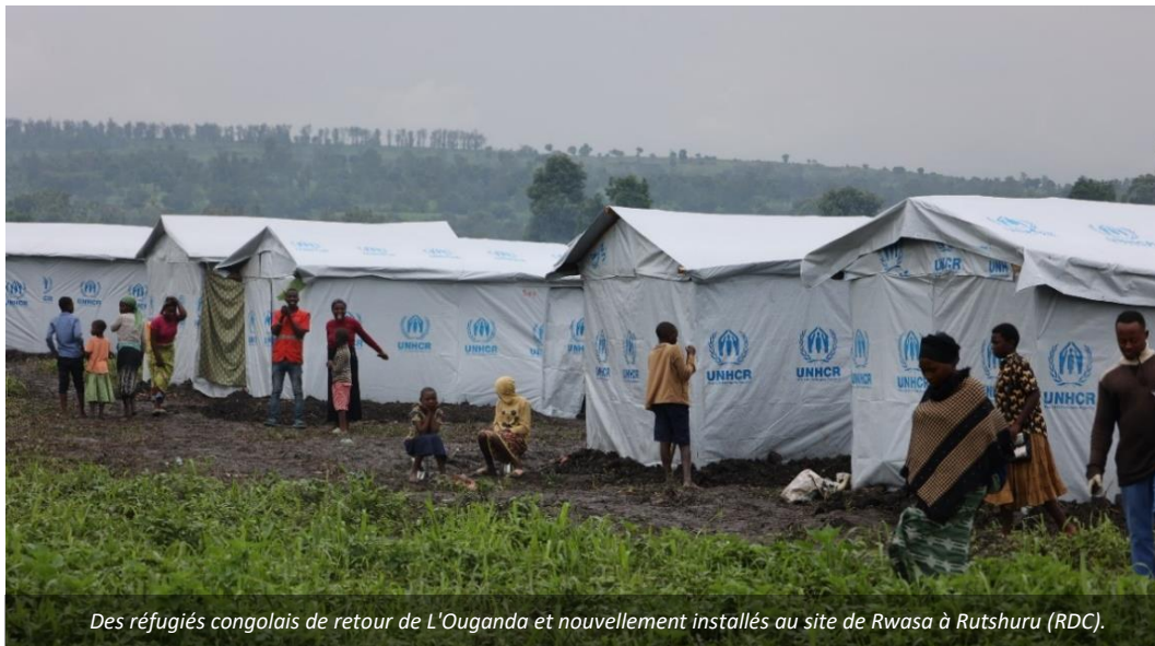
Des réfugiés congolais de retour de L'Ouganda et nouvellement installés au site de Rwsa à Rutshuru (RDC).