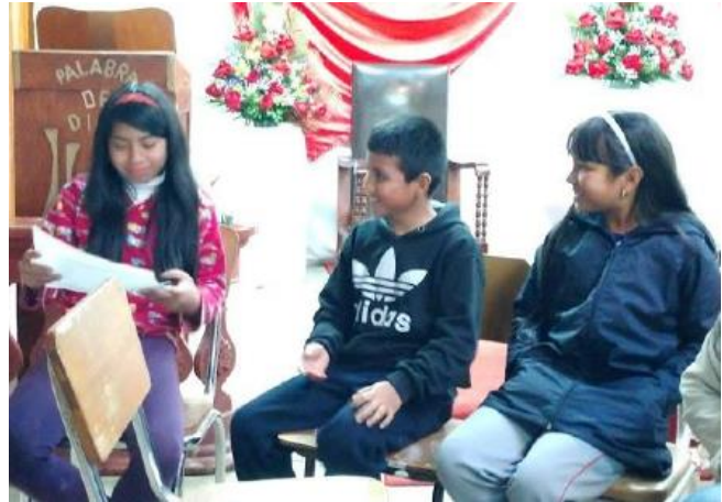
Encuentro con la comunidad del barrio Juan Pablo II - Comuna 10, Pasto, Nariño

Por otro lado, la Defensoría Delegada para la Infancia, la Juventud y el Adulto Mayor de la Defensoría del Pueblo informó que, durante la pandemia, los NNA refugiados y migrantes abandonaron la escuela debido a las dificultades de conectividad. Entre los principales obstáculos a la educación se encontraban la falta de