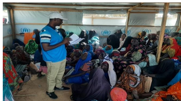
Sensibilisation des femmes réfugiées sur la déclaration des naissances des nouveau-nés au camp de Kalambari © UNHCR, Janvier 2023

Les femmes réfugiées du camp de Kalambari reçoivent une sensibilisation à l'enregistrement des naissances. Le 3 janvier, 85 femmes du camp de Kalambari ont participé à une rencontre communautaire sur l'importance de l'enregistrement des naissances et les démarches à suivre pour enregistrer les nouveau-nés. Au Tchad, le HCR travaille avec le gouvernement pour appuyer l'enregistrement et le système de documentation de l'état civil et de l'identité.