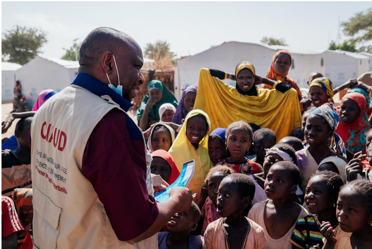
Séance de sensibilisation au "village d'opportunités" de Chadakori.

les trois "villages d'opportunités" et sur les sites de Tiadi, Elguidi et Dan Kano dans le département de Guidan Roudji. Enfin, plus de 2.478 enfants ont été sensibilisés aux questions de protection de l'enfance.