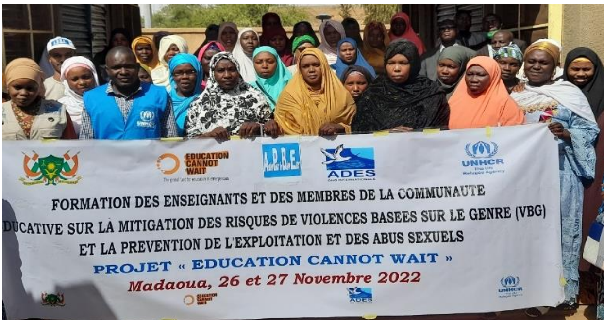
Photo de famille des participants à la formation des enseignants et des membres de la communauté éducative sur la prévention de la VBG et le PEAS.

A la fin de l'année 2022, un total de 94 enseignants au sein de 13 écoles primaires et secondaires du département de Madaoua ont été formés sur l'atténuation des risques de violence basée sur le genre (VBG) et sur la prévention de l'exploitation et des abus sexuels (PEAS) , en apprenant le code de conduite, la gestion des survivants, le rôle des structures communautaires dans la gestion des cas de VBG. Enfin, le système de signalement a été évalué et mis à jour et des points focaux VBG et PEAS ont été nommés dans certaines écoles sélectionnées.