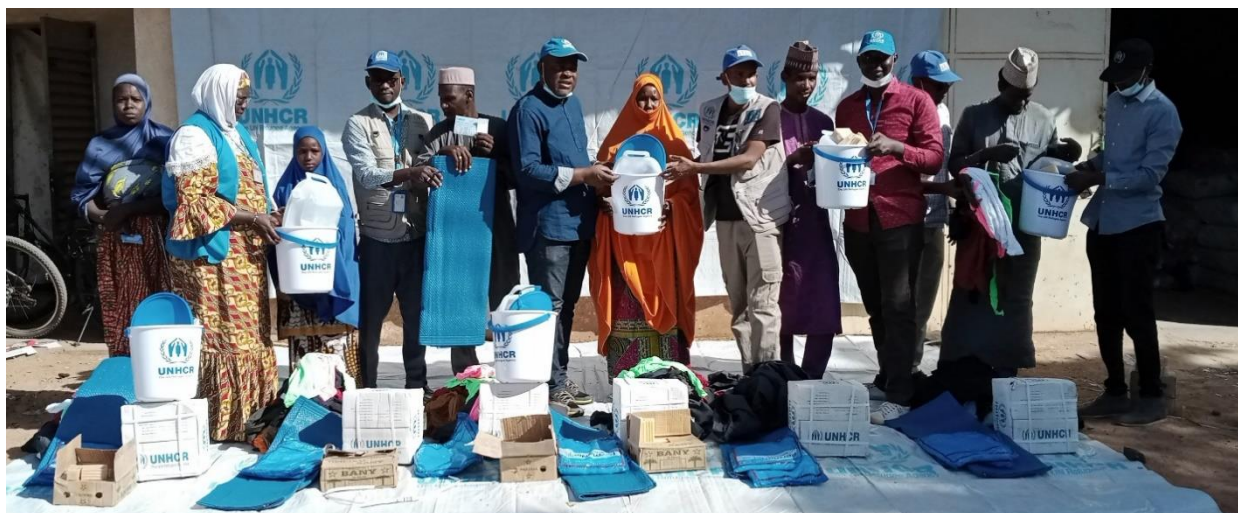
Distribution de biens non alimentaires aux réfugiés et demandeurs d'asile burkinabés nouvellement arrivés à Tera.

La municipalité de Tera et la Direction départementale de l'état civil, avec le soutien du HCR et de ses partenaires, poursuivent l'enregistrement de niveau 1 des demandeurs d'asile burkinabés arrivés à Tera début novembre. Au 31 décembre 2022, un total de 1.711 ménages (9.449 personnes) a été enregistré. Le HCR, à travers son partenaire Action Pour le Bien-Être (APBE), a distribué des articles de bien non-alimentaires et des vêtements aux personnes nouvellement arrivées du Burkina Faso.