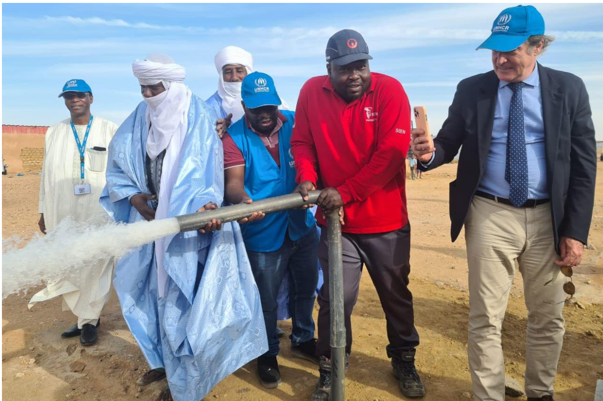
Le Représentant du HCR et les autorités locales d'Agadez lors de la cérémonie officielle de remise des travaux d'extension du réseau d'eau.

Le 6 décembre, une cérémonie officielle a eu lieu pour inaugurer une extension d'eau, qui relie le système d'eau d'Agadez au centre humanitaire à celui des communautés voisines , afin de garantir l'accès à l'eau potable aux réfugiés et aux Nigériens qui y vivent.