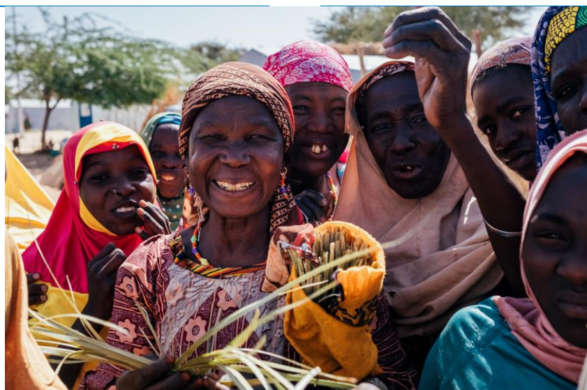
Femmes nigérianes, réfugiées et artisanes au "Village d'opportunités" de Chadakori à Maradi.