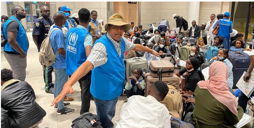
Le 1er novembre, le HCR Niger a reçu 174 demandeurs d'asile, qui ont été évacués de Libye vers le Niger via ETM.

Au 31 décembre, 5.096 réfugiés ont quitté le Niger vers des pays tiers dans le cadre de la réinstallation ou par les voies complémentaires. Parmi eux, 3.526 personnes évacuées de la Libye par le biais du mécanisme de transit d'urgence (ETM) et 1.570 réfugiés enregistrés au Niger.