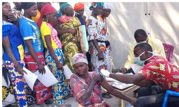
Une femme réfugiée reçoit son vaccin COVID19, à Moissala. Au Tchad le HCR avec le soutien de la Banque Mondiale appuie le plan national de déploiement et de vaccination contre la COVID-19 © UNHCR, Janvier 2023

Du 24 au 25 janvier, le HCR a organisé une formation en faveur des leaders communautaires du Ouaddaï en charge des campagnes de sensibilisation sur la vaccination contre la COVID-19 auprès des réfugiés et des communautés d'accueil. Cette formation a été organisée dans le cadre du projet d'appui à la mise en œuvre du plan national de déploiement et de vaccination contre la COVID-19 financé par la Banque mondiale. Le projet vise à vacciner plus de 290 000 réfugiés et communautés hôtes au Tchad d'ici juillet 2023.